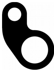
Haltekit 45° Art.Nr. 1200 23,2 x 30 mm