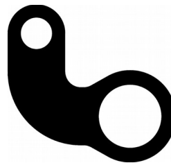
Haltekit 90° Art.Nr. 1201 32,2 x 30 mm